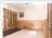
▲居室専用 エントランス