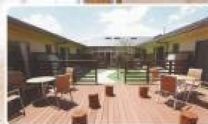
中庭(デッキテラス)▶