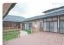
中庭(デッキテラス) 居 室